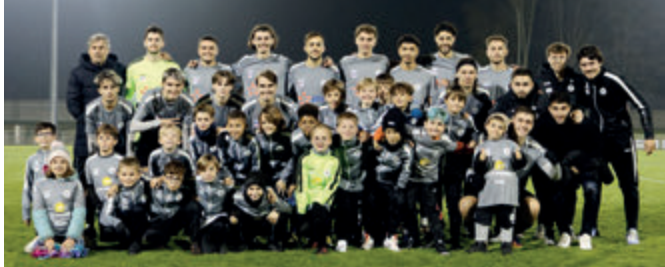
Notre équipe fanion avec une délégation de nos plus jeunes lors de la rencontre à Saint-Louis

Chers amis sportifs, le cycle aller touche à sa fin et, avec lui, une première partie de saison riche en efforts, en progrès et en émotions. Nous approchons désormais de la pause hivernale, ce moment où chacun pourra souffler, récupérer et préparer la suite avec encore plus d'énergie.